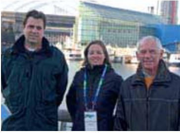
2 VANOC beschikt over veel ervaren mensen'