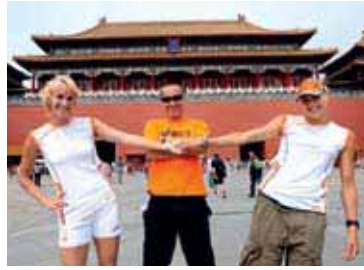
3 Drie Paralympische fulltimecoaches erbij