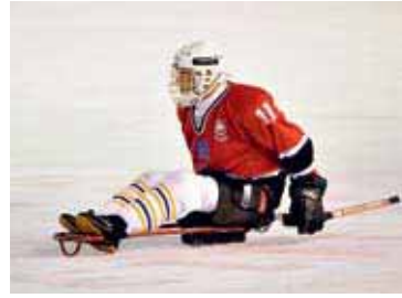
5 Vancouver 2010: kansen voor skiën en icesledgehockey