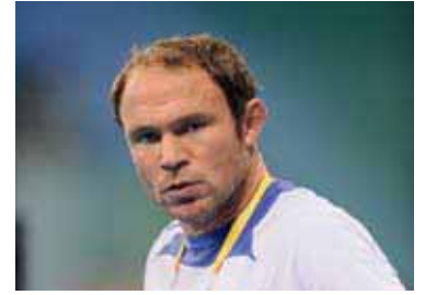
8 NCP over lessen van Beijing