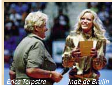
Erica Terpstra Inge de Bruijn

Vooral haar aansprekende Olympische prestaties hebben De Bruijn tot een sportlegende gemaakt. In Sydney 2000