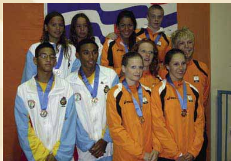
De Nederlandse zwemploeg haalde de meeste punten in hun competitie.

gouden medailles overduidelijk eerste. De zwemploeg uit Nederland wist ook de meeste punten te verzamelen in hun competitie; datzelfde gold voor het synchroonzwemmen.