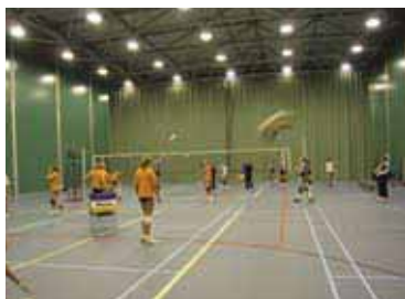
2 Semipermanente sporthallen van Official Supplier Neptunus