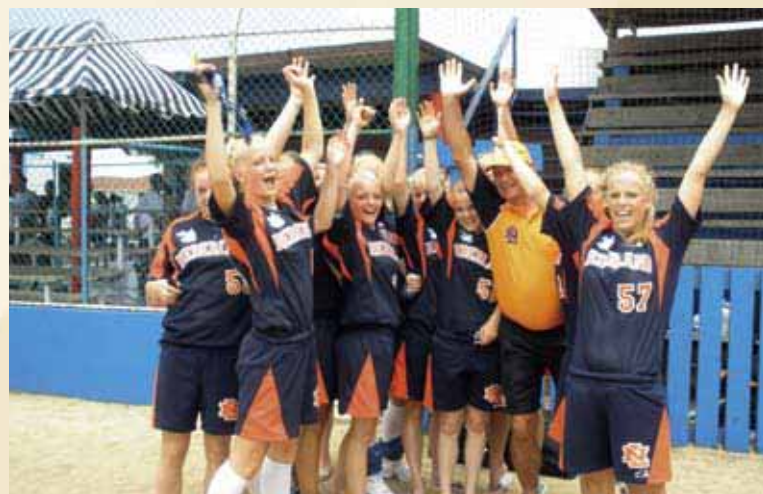
Het Nederlands softbalteam won op de Koninkrijksspelen een zilveren medaille.

spelen stond in het teken van de finales. Hierbij werden de gouden medailles mooi verdeeld: goud voor de Nederlandse voetballers, goud voor de Antilliaanse softballers (zilver voor Nederland) en goud voor de Arubaanse honkballers (Nederland derde). Bij atletiek werd Nederland eerste. De tweede plek was voor de Nederlandse Antillen, derde werd Aruba. De Nederlandse taekwondoka's deden het buitengewoon goed en werden met zes