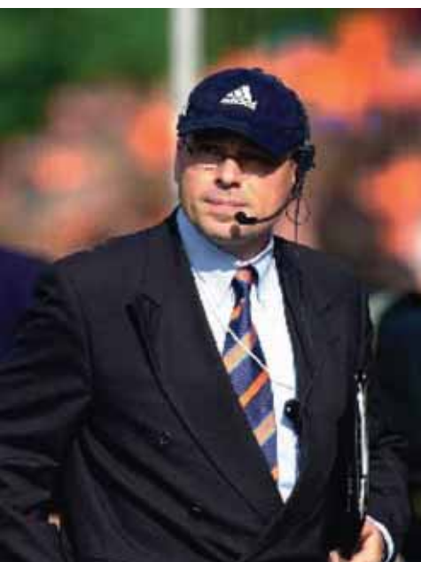
Bondscoach Nederlandse mannen in 2000