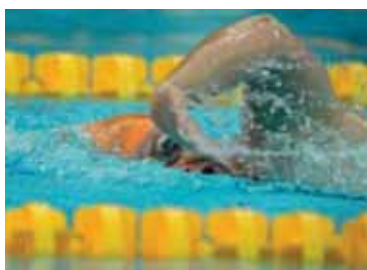
2 TalentSwitch vergroot Paralympische kweekvijver