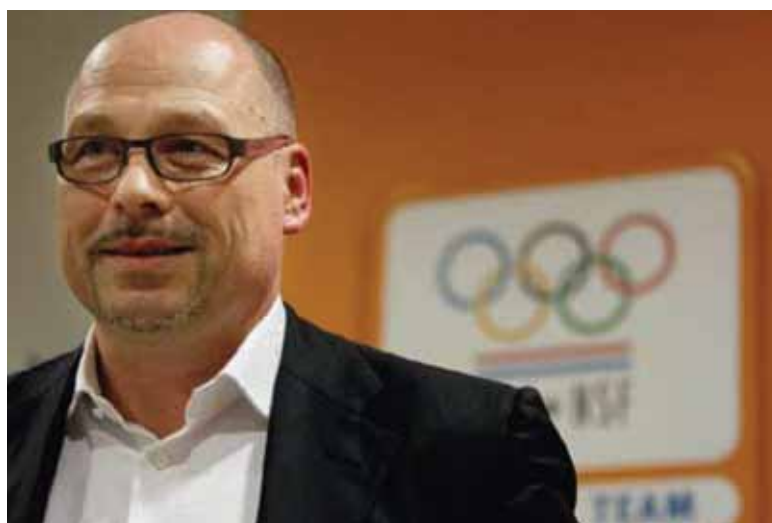
'We moeten topsporters nog meer als toppers gaan behandelen.'

In Lopend Vuur zal Hendriks dit jaar nader ingaan op een aantal thema's waarvoor hij zich de komende jaren extra gaat inzetten, bijvoorbeeld de positie van de topsporter ('Die is de afgelopen tijd al sterk verbeterd, maar nu moeten we ze nog meer als toppers gaan behandelen'), de manier waarop er in Nederland wordt aangekeken tegen talent ('In Spanje zitten de jongeren eerder op het internationale niveau; daarin kunnen wij nog wel een stap maken') en inno-