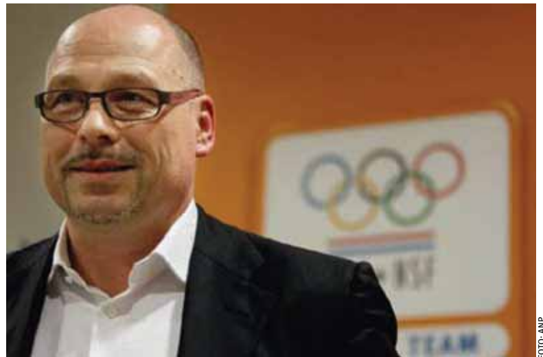
'We moeten topsporters nog meer als toppers gaan behandelen.'