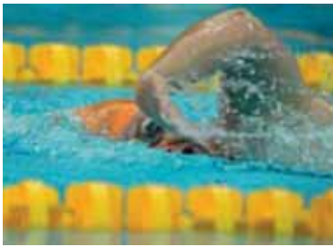
2 TalentSwitch vergroot Paralympische kweekvijver