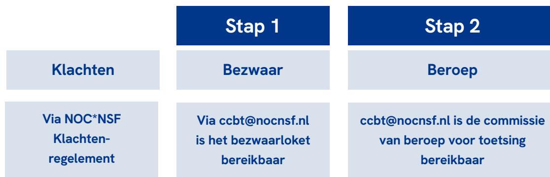
Afbeelding 2: Stappenplan klacht, bezwaar en beroep

De werkwijze van de regeling “Beroepszaken” is verder beschreven in Reglement en werkwijze CCBT.