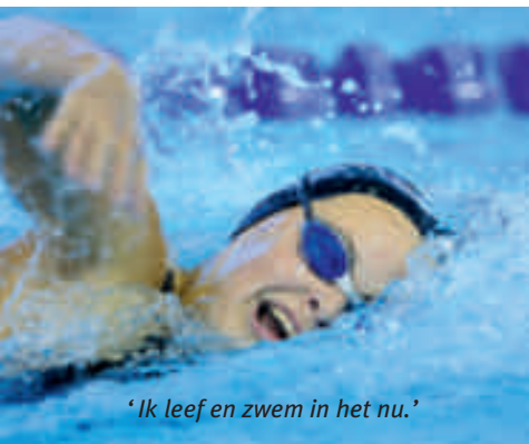
‘Ik leef en zwem in het nu.’