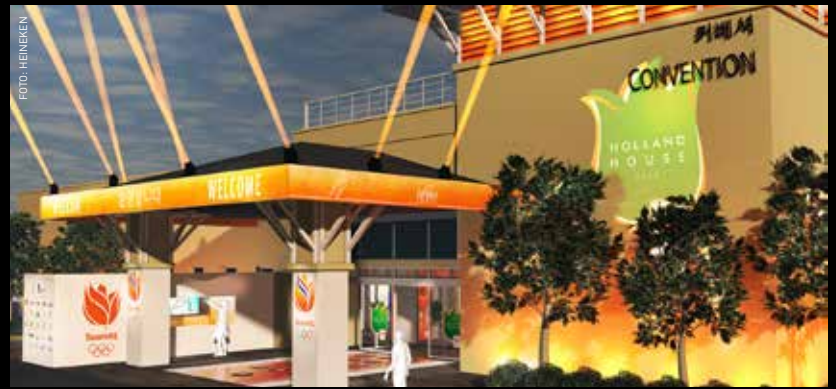
"Samen met Nederland vier je in het HHH waar je zo hard voor hebt gewerkt."

thuisblijvers, met 's morgens Evers Staat Op op Radio 538, overdag veel online en 's avonds beelden op SBS6. "We zijn er de klok rond. We zijn niet alleen bezig om in Zuid-Korea iets neer te zetten, maar ook met de vraag: Hoe zorgen we ervoor dat de mensen in de file op de A2 de huldiging meekrijgen? We zijn er erg trots op wat we met een team van 120 mensen neerzetten en wat het Holland Heineken House elke keer weer teweegbrengt."