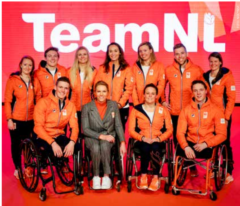
De paralympische ploeg met chef de mission Esther Vergeer.

Terwijl de Olympische Spelen in volle gang zijn, zitten de Nederlandse paralympiërs te trappelen om over een maand ook in actie te komen in PyeongChang. Hoe staan de snowboarders en alpineskiërs er nu voor? En wat gaat ze in die laatste weken doen?