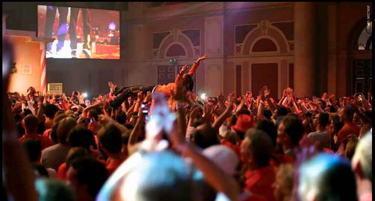
“Hoe meer er gevierd wordt, hoe dichter je bij de bar komt.”

Het Holland Heineken House is dé plek waar de Nederlandse sporters en hun fans samenkomen. Volgens De Liefde is de scheidslijn tussen NOC*NSF en Heineken heel helder. “NOC*NSF begeleidt de lange weg